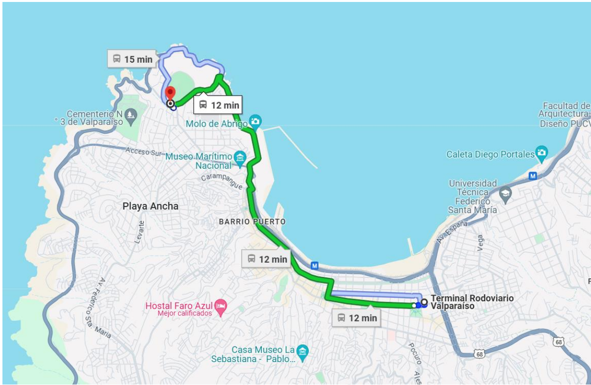
Trayecto desde el Terminal de buses de Valparaíso hasta la UPLA en microbús

Las actividades transcurrirán, principalmente, en la Casa Central de la universidad (Avenida Playa Ancha N° 850 https://maps.app.goo.gl/hbRKilkevjtU64as8 ), siendo el primer punto de encuentro el Aula Magna Dr. Félix Morales Pettorino, ubicada en el punto E del plano.